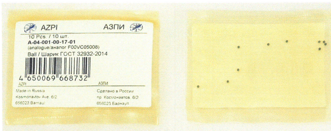
Рисунок 3 – Упаковка керамического шарика «А-04-001-00-17-01».

Керамический шарик имеет цветовое отличие (черный цвет) и с начала июня 2020г. будет выпущен в продажу под обозначением «А-04-001-00-17-01». Шарика, в кол-ве 10 шт., упакованы в индивидуальную упаковку (пакет из ингибированной полиэтиленовой пленки) по аналогии со стальным шариком «А-04-001-00-17-00» (см. рисунок 3).